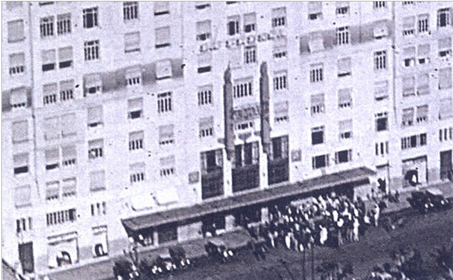
Marquise destruída em 1930 - Tirantes a 45 graus sustentavam a marquise.

"Ampliação de uma foto de 1930 mostrando os detalhes da fachada inferior do Edifício A NOITE , como a marquise , as grandes aberturas da entrada monumental e os elementos decorativos verticais. Todos esses elementos desapareceram em 1930."