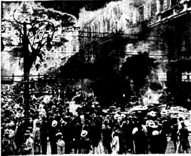
A multidão, em frente à redacção do "O País", à esquerda da Avenida Rio Branco e rua 7 de Setembro

(Continuação de "O País") A situação da paisa O governo depois, ao permitir a divulgação de informações tendenciosas sobre seus feitos, deu causa a mais característica das revoltas populares, a desconfiança do povo, a verdadeira situação da paisa, da qual se passou a falar.