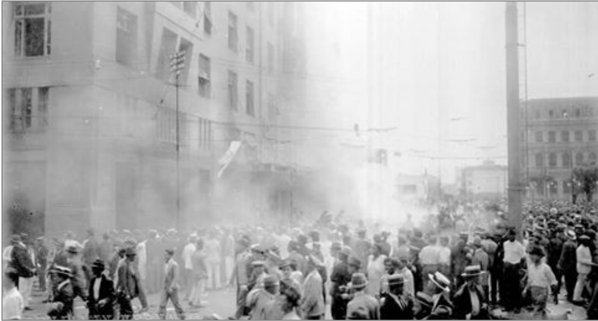
1930 - Foto do Jornal A NOITE