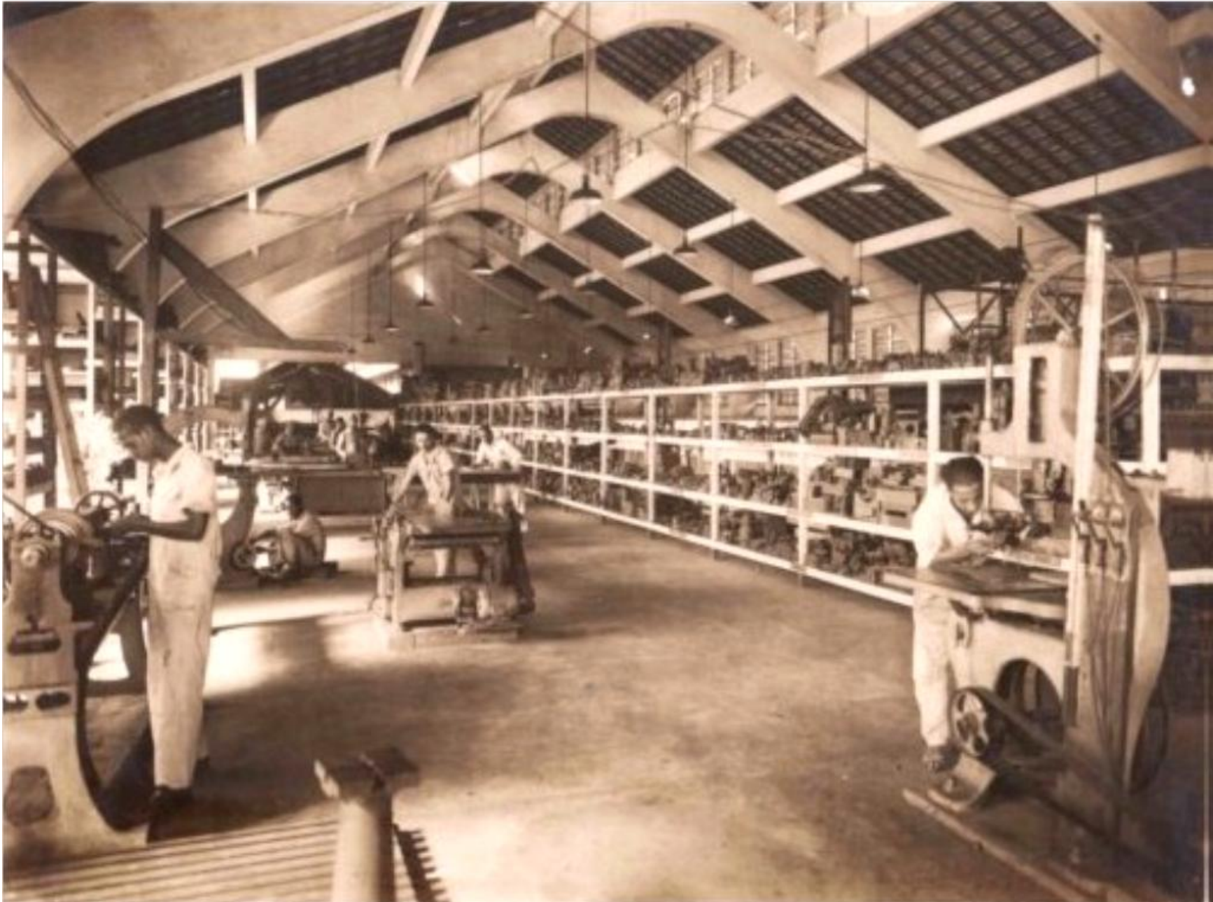
Oficina de correaria e modelos.