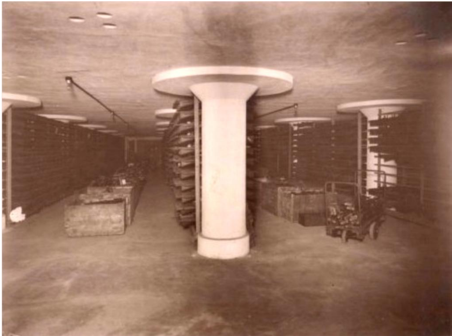
LAJE COGUMELO DE CONCRETO ARMADO